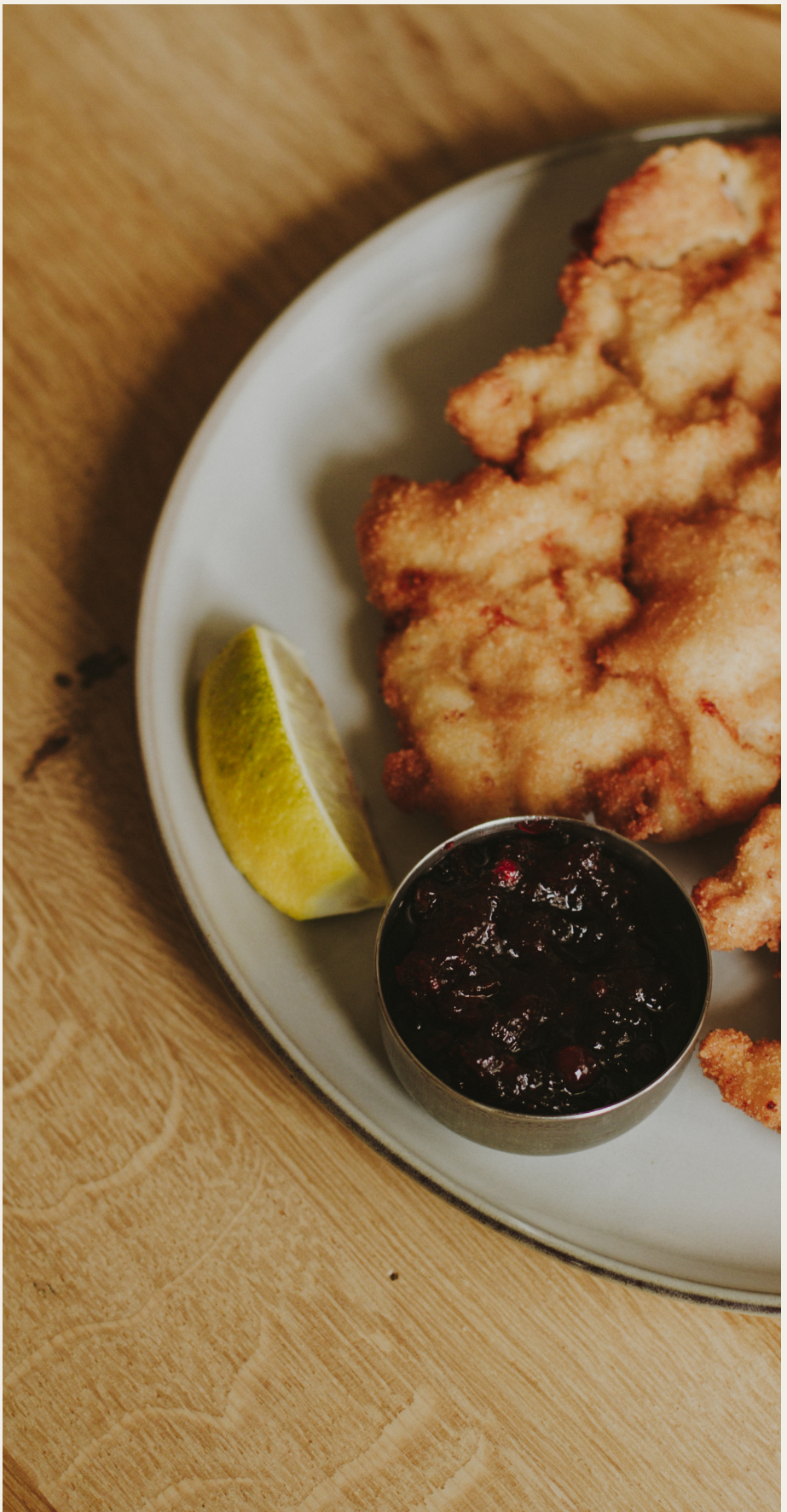
SCHNITZEL VOM BIO-WALDROC-SCHWEIN